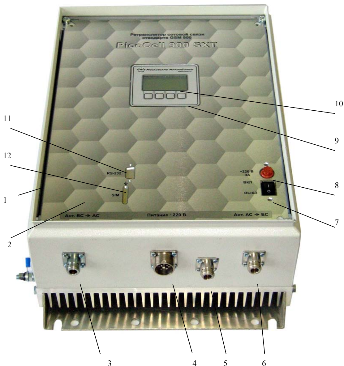
Рис.1 Ретранслятор PicoCell 900 SXT (без крышки)

Вся информация, необходимая при настройке системы, при монтаже и при дальнейшем обслуживании, отображается на графическом ЖК-дисплее, расположенном на корпусе ретранслятора. Настройка производится с клавиатуры, расположенной под дисплеем, с помощью русскоязычного меню.